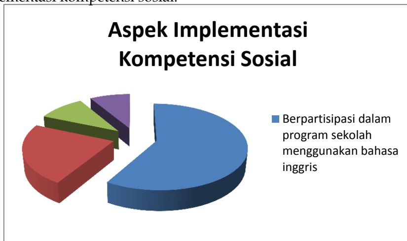
Diagram Pie. 3 Aspek Implementasi Kompetensi Sosial

menerapkan program-program yang menggunakan bahasa inggris, menunjukkan sikap literasi bahasa inggris yang baik menjadi teladan di media sosial, mencoba menggunakan bahasa inggris dengan rekan sejawat dan atasan dalam lingkup sekolah, antar-sekolah dan inter-sekolah, dan melakukan konseling, parent's visit dengan orang tua/wali siswa jika kebetulan adalah penurur asli bahasa inggris/ekspatriat. Diagram Pie.3 mengilustrasikan aspek implementasi kompetensi sosial.