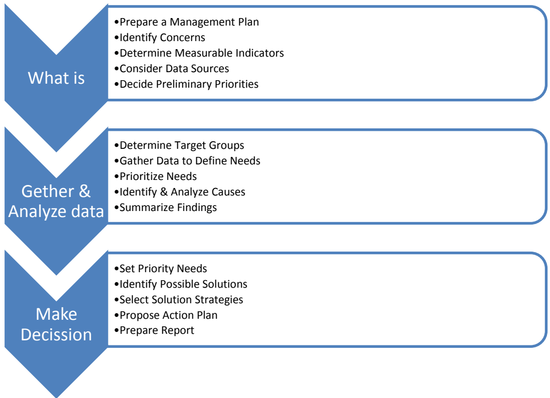
Gambar 2. Alur Tahapan Pada Comprehensive Needs Assessment (CNA 1995)