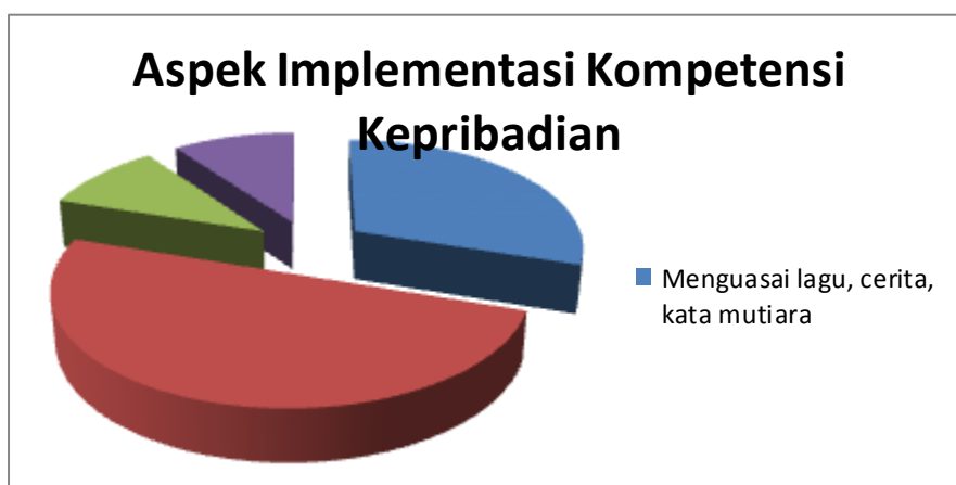
Diagram Pie. 2 Aspek Implementasi Kompetensi Kepribadian

Sedangkan pada aspek implementasi aspek kompetensi kepribadian terdapat 4 jawaban teratas yaitu: menguasai lagu-lagu anak berbahasa inggris, cerita pendek, kata mutiara, mampu berkhotbah dalam bahasa inggris, menjadi mentor pada lomba-lomba yang menggunakan bahasa inggris, dan menjadi problem solver ketika siswa mendapatkan kesulitan untuk menerjemahkan kata atau kalimat dalam dalam agama buddha ke dalam bahasa inggris. Diagram Pie.2 mengilustrasikan aspek implementasi kompetensi kepribadian.